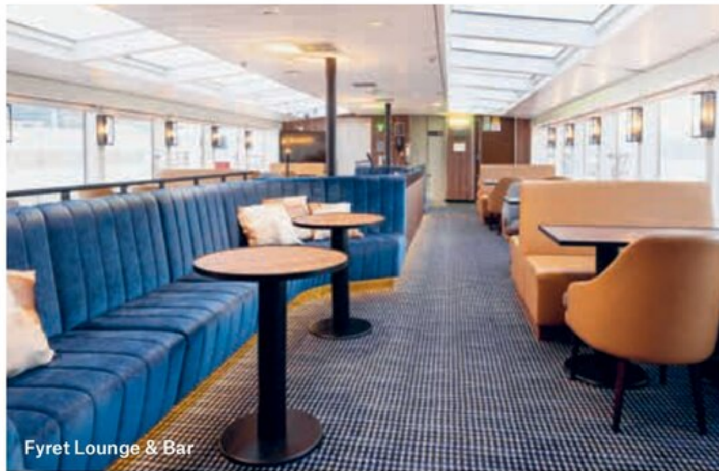
Fyret Lounge & Bar